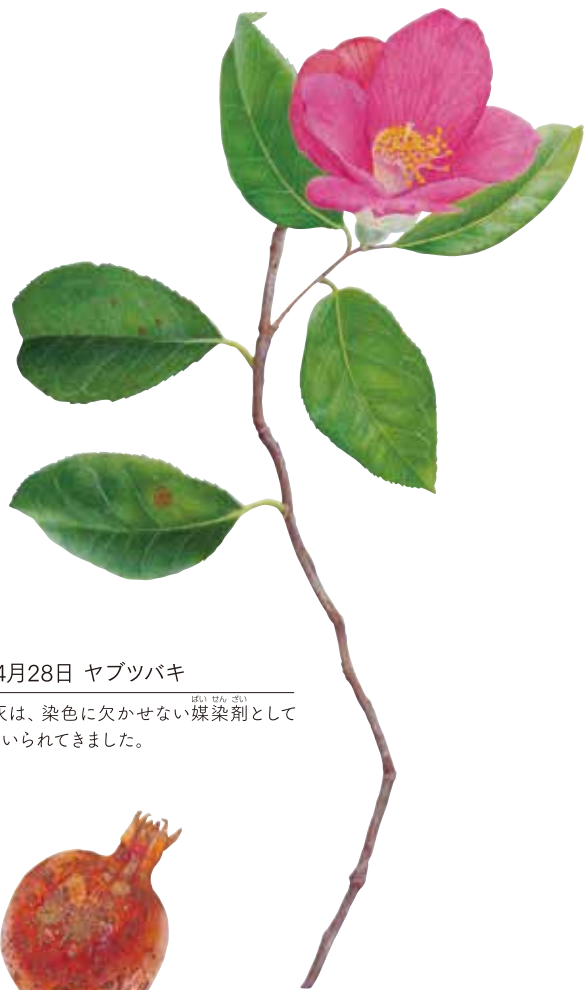
2008年4月28日 ヤブツバキ